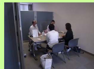
※個別商談会のイメージ