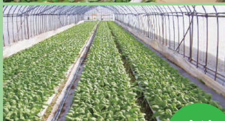
(有)アグリタウン 宝達志水町

水稲とビニールハウスでのチンゲンサイ栽培の複合経営を行っており、中でもチンゲンサイは県下最大の生産を誇ります。