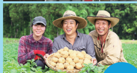
(株)能登風土 七尾市