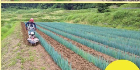
(農)なたうち 七尾市

美しい棚田が広がる中山間地域で、水稲に加え能登白ネギや小菊かぼちゃなどの「能登野菜」を栽培しています。また、積極的に県外からの農業体験の受け入れや地域との交流を行っており、都市圏からの移住就農者も活躍しています。